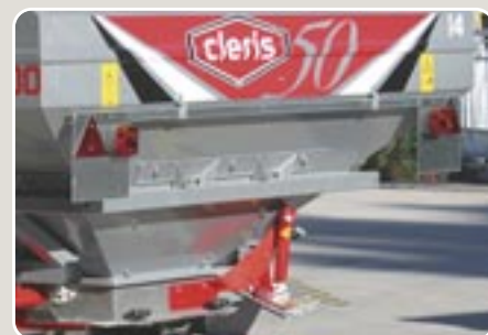
9 Equipo de luces Lights and electrical equipment