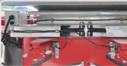
18 Control electrónico de la dosificación Electronic spreading rate control