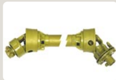
3 Transmisión cardán de rueda libre-embrague Free-wheel joint cardan shaft-clutch