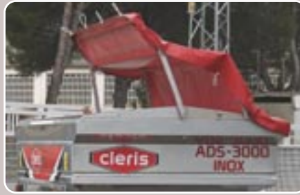
13 Toldo plegable articulado Tarpaulin top cover with folded frame