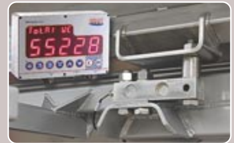
19 Sistema de pesaje continuo Continuous weighing system