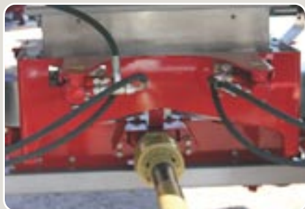
4 Doble mando hidráulico de apertura y cierre Double hydraulic driven feeding gate