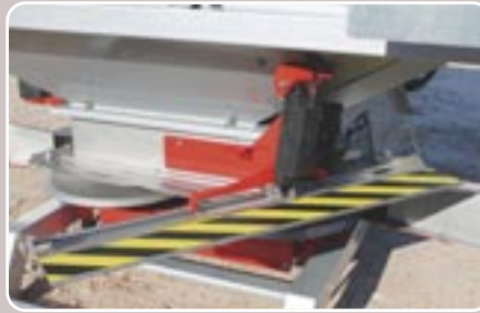
16 Bordeador BLS para trabajar desde el borde Border spreading system BLS for working from the border