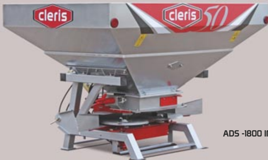
ADS -1800 INOX