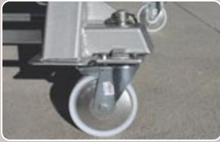
12 Base con ruedas Base with wheels