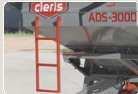
6 Escalera de acceso Access ladder