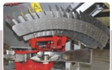
23 Bordeador BLX Border spreading system BLX