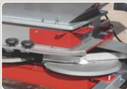
2 Discos, agitador y fondo de tolva de acero inoxidable. Grupo distribuidor TDC-540 Stainless steel discs, agitator and backdrop hopper. Gear distributing TDC-540