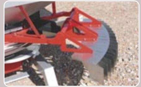
17 Bordeador BLX Border spreading system BLX