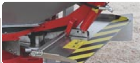
22 Bordeador BLS para trabajar desde el borde Border spreading system BLS for working from the border