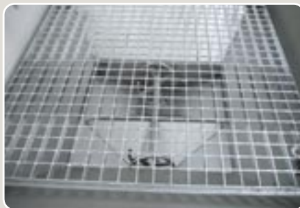
5 Malla criba galvanizada de paso reducido Reinforced galvanized sieve with tiny hole