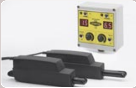
15 Apertura eléctrica de la dosificación Electronic spreading rate opening control