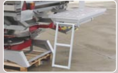
14 Plataforma trasera con escalera plegable Rear platform with folding ladder