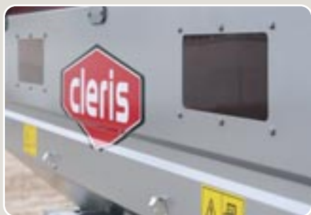
1 Visor delantero de metacrilato Frontal methacrylate viewfinder