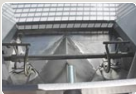
7 Agitador de bajas revoluciones con sistema hidráulico independiente Low speed revolutions agitator with independent hydraulic system