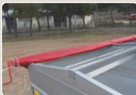
8 Toldo abatible, tipo camión, con arquillos de chapa plegada Lorry type folding tarpaulin with folded sheet