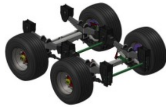
Suspensión tándem multi-hoja Schulz Ibérica. Tambores 400x80. Opcional: 400x120