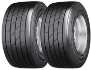
Neumáticos: 435/50 R19,5"