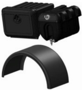
Cajón de herramientas, depósito lavamanos y aletas guardabarros PVC.