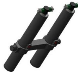
Cilindro omega central adelantado, con válvula de seguridad paracaídas.