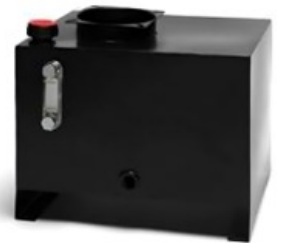
Opcional: Grupo independiente de aceite para botella del basculante.