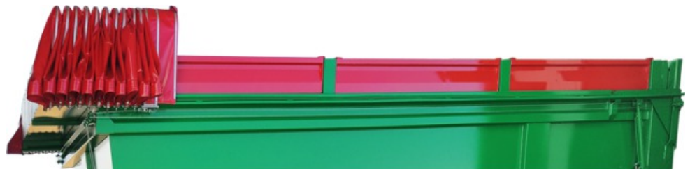
Opcionales: Lona tipo corredera o abrelatas. Suplemento caja con cartolas desmontables +300 mm