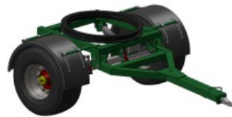
Rodete "LA LEONESA"