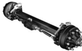
Opcional: Eje direccional, con bloqueo hidráulico y tambor 400x120